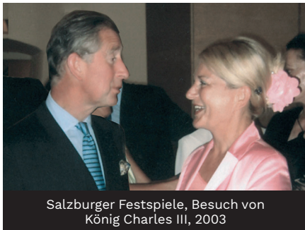
Salzburger Festspiele, Besuch von König Charles III, 2003

Seit 1945 Publikation der nun- mehrigen Österreichischen Gesellschaft für Außenpolitik und die Vereinten Nationen ÖGAVN