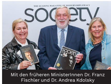
Mit den früheren MinisterInnen Dr. Franz Fischler und Dr. Andrea Kdolsky