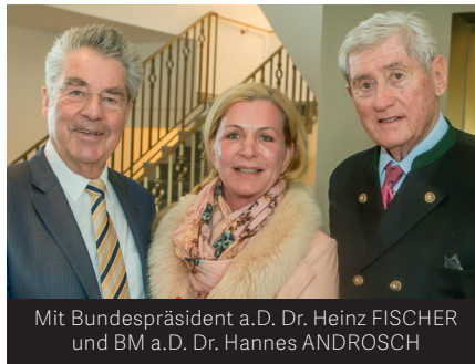
Mit Bundespräsident a.D. Dr. Heinz FISCHER und BM a.D. Dr. Hannes ANDROSCH