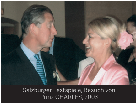
Salzburger Festspiele, Besuch von Prinz CHARLES, 2003