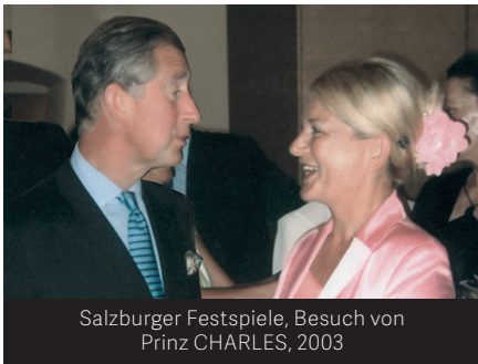
Salzburger Festspiele, Besuch von Prinz CHARLES, 2003