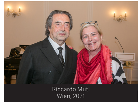
Riccardo Muti Wien, 2021