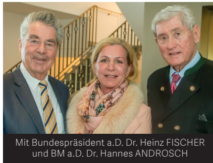
Mit Bundespräsident a.D. Dr. Heinz FISCHER und BM a.D. Dr. Hannes ANDROSCH